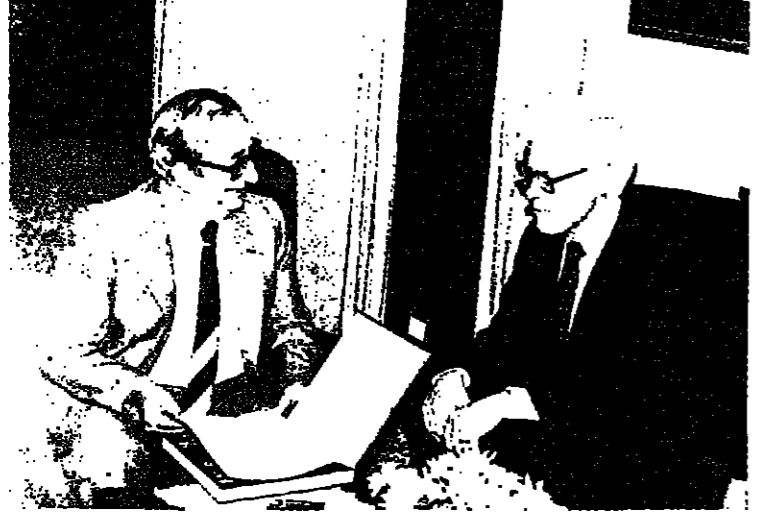
رئيس الدولة أثناء اجتماعه بالسيد جون أندرسون أمس

ة - صرح الرئيس المصري انور السادات ان مفاوضات الحكم الذاتي ستستأنف في الاسكندرية وان تأجيل استئنافها يرجع ك فنية بحته منها انشغال وزير الدولة للشؤون الخارجية الدكتور بطرس غالي في مهمة في أوروبا . وقد اطل الرئيس السادات بهذا التصريح للتلفزيون